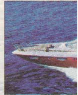
Azimut 103S, vivibilità esterna e

La Emerald Star, un 43 metri, ospita dieci passeggeri e nove membri di equipaggio