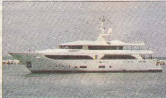
Emerald Star (Ferretti-Cm), per lunghe crociere

ingusta 165, un motoryacht veloce e comfort, prodotto dalla Overmarine