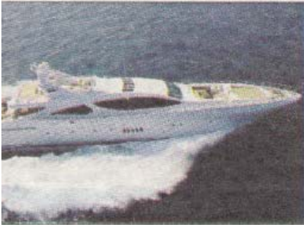
165, tutto per il comfort

ingusta 165, un motoryacht veloce e comfort, prodotto dalla Overmarine