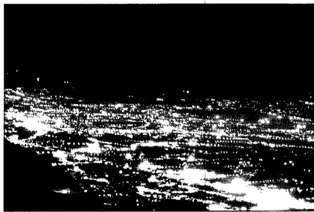
Una immagine notturna del Vesuvio visto dal Salernitano

La conferma: Napoli fuori dalla Zona rossa