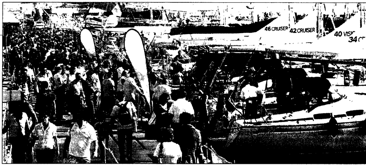
Una panoramica del Salone della nautica di Genova. In basso a sinistra il ministro Bersani con il presidente di Ucina Albertoni

Inaugurata l'edizione 2007 della rassegna per il diporto più importante del mondo Made in Italy protagonista