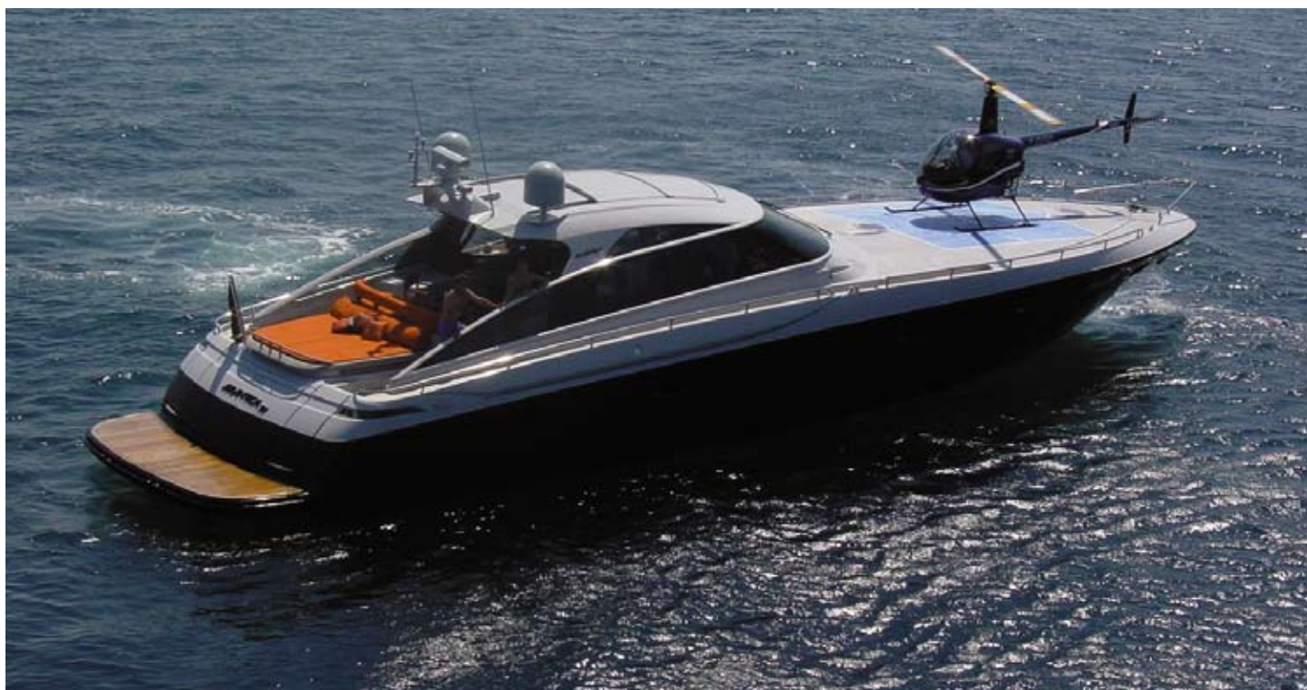
ŁĄDOWISKO NA DZIOBIE DLA HELIKOPTERA, ABY NIE TRACIĆ CZASU NA PARKOWANIE W MARINIE

Cantieri di Baia to ekskluzywna włoska stocznia budująca jachty motorowe już od 1961 r. Do grona posiadaczy tych luksusowych jachtów należą m.in. Bruce Willis, Demi Moore, Burt Reynolds oraz Ivana Trump.